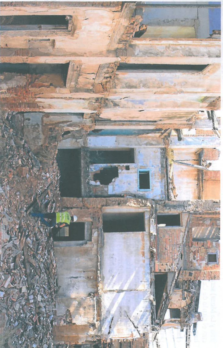
Se trataron temas como la limpieza, la seguridad y el uso de las viviendas de las Medranas.